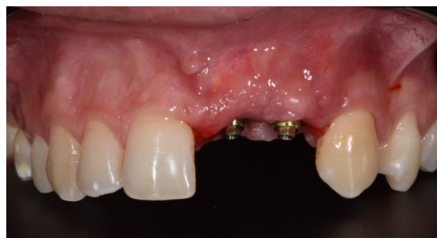
Figura 8. Aspecto clínico após 90 dias.

Pós-operatório Imediato: A avaliação no 7º dia pós-operatório demonstrou ausência de edema significativo, adequada cicatrização dos tecidos moles e manutenção volumétrica vestibular (Figura 7). Os provisórios mantiveram perfil de emergência estável e sem sinais de inflamação peri-implantar.