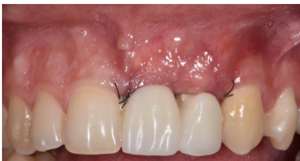
Figura 6. Aspecto clínico pós-cirúrgico imediato com provisionalização.

Provisionalização Imediata: Após a instalação dos implantes, foram colocados minipilares com cinta cervical de 1mm e 2mm, seguidos de confecção e instalação de coroas provisórias ferulizadas em carga imediata. A estratégia de ferulização foi adotada para distribuir uniformemente cargas excêntricas e reduzir risco de micromovimentação, alinhada a protocolos prognósticos de sucesso em carga imediata 2,6 .