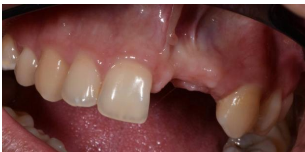
Figura 5. Aspecto clínico do rebordo alveolar após exodontia prévia traumática, com deficiência volumétrica de tecidos duros e moles na região anterior da maxila, caracterizando defeito horizontal vestibular severo.

Procedimento Cirúrgico e Regeneração Tecidual: Confeccionou-se guia cirúrgica personalizada utilizando o kit de cirurgia guiada Narrow da MIS. Com anestesia local, a técnica guiada permitiu abertura mínima de retalho e instalação precisa dos implantes na posição planejada. Foi observada presença de defeito ósseo vestibular severo, tratado com matriz colágena Ossix Volumax associada à membrana reabsorvível, seguindo o protocolo de regeneração de carga óssea e gengival simultâneo — estratégia apoiada por evidências recentes que demonstram ganho volumétrico significativo sem necessidade de enxertos autógenos 9 .