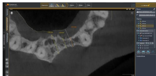
Figura 1. Tomografia computadorizada de feixe cônico em corte axial da região dos dentes 21 e 22 evidenciando defeito ósseo vestibular severo e concavidade do rebordo alveolar após trauma dentoalveolar. Observa-se remanescente ósseo limitado em espessura vestibulo-palatina, comprometendo o posicionamento tridimensional ideal dos implantes.

O planejamento foi realizado no software Sidexis 4, integrando a tomografia com escaneamento intraoral e posicionamento virtual dos implantes proteticamente orientado. Dois implantes estreitos MIS (3.3 x 11.5 mm) foram selecionados para otimização biomecânica dentro das restrições anatômicas, com foco em alcançar uma estabilidade primária \geq 35 Ncm, critério frequentemente citado na literatura para viabilizar carga imediata segura 8 .