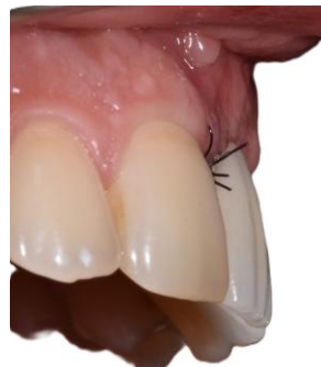
Figura 7. Aspecto clínico visão lateral pós-cirúrgico imediato com provisionalização.

Pós-operatório Imediato: A avaliação no 7º dia pós-operatório demonstrou ausência de edema significativo, adequada cicatrização dos tecidos moles e manutenção volumétrica vestibular (Figura 7). Os provisórios mantiveram perfil de emergência estável e sem sinais de inflamação peri-implantar.