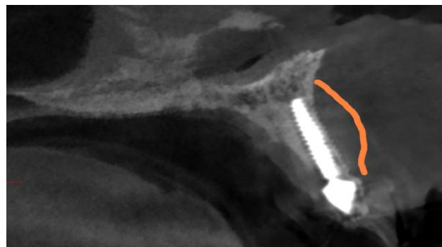
Figura 9. Aspecto tomográfico após 90 dias.