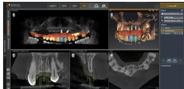
Figura 3. Planejamento tridimensional com sobreposição de escaneamento intraoral e tomografia no software Sidexis 4, demonstrando o posicionamento proteticamente guiado dos implantes nas regiões dos dentes 21 e 22 e o desenho da guia cirúrgica. Planejamento virtual dos implantes, evidenciando o correto eixo protético, profundidade de instalação e relação com os dentes adjacentes, reforçando a previsibilidade da cirurgia guiada.