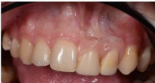
Figura 4. Aspecto clínico pré-operatório evidenciando colapso de tecidos moles e concavidade vestibular acentuada na região dos dentes 21 e 22, associada ao uso prévio de prótese parcial removível provisória mal adaptada.