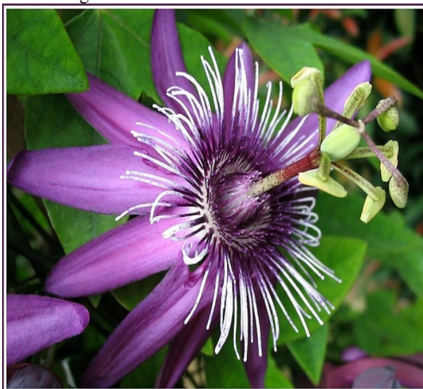
Figura 1. Passiflora incarnata L. – Flor

O fruto, quando presente, apresenta pericarpo carnosso, indeiscente e várias sementes pequenas, o que caracteriza a baga 18 .