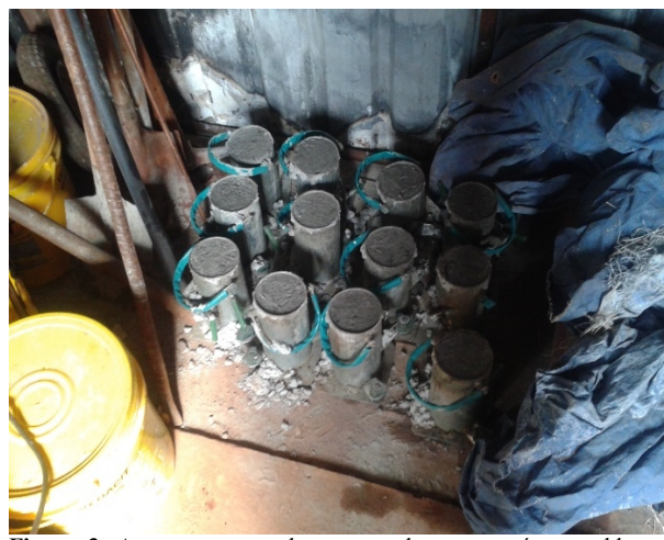
Figura 3. Armazenamento dos corpos de prova após a moldagem.

Cada corpo de prova seguiu o processo determinado pela NBR 5738 14 que determina que, inicialmente segundo o item 7.2 os moldes sejam preparados com uma camada de óleo mineral para auxiliar na desforma. Segundo o item 7.4.2, que rege o procedimento de adensamento manual, que por serem de moldes de 100mm, as amostras foram moldadas em duas camadas iguais, sendo cada camada adensada com doze golpes de maneira circular. Os corpos de prova foram moldados em locais onde não haveria a incidência de sol, para que as amostras não perdessem a umidade, e também não houvesse a necessidade de uma movimentação após a moldagem, determinada no item 7.3 da mesma norma.