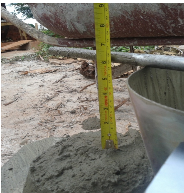
Figura 2. Slump Test realizado “in loco”.

Com a base nivelada, iniciou-se o Slump Test com concreto produzido na obra, sendo o mesmo colocado em três camadas, adensando cada camada com vinte e cinco golpes de forma circular a fim de garantir o melhor adensamento proposto pela NBR NM 67 15 . Após o término da última camada do Slump Test, retirou-se o cone de Abrams e com o auxílio da haste e uma trena, se obteve em centímetros o abatimento do concreto, sendo que o mesmo foi realizado no mínimo duas vezes em cada obra a fim de garantir o resultado obtido.