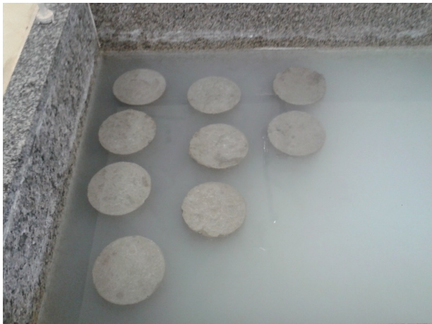
Figura 4. Corpos de prova emersos em água em processo de cura úmida.

no tanque de cura, emersos em água, sendo adicionado cal hidratada para auxiliar este processo. As amostras ficaram emersas em água até o dia de rompimento para garantir a sua cura e ganho de resistência em favor do tempo.