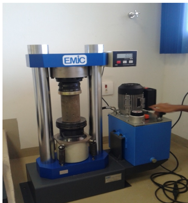
Figura 5. Rompimento de corpos de prova em prensa hidráulica.

Com os dados obtidos pela prensa hidráulica, foi elaborado uma tabela com os dados de cada amostra, e posteriormente a média amostral por dia de rompimento, obtendo assim o F_{cj} (Resistência Média do Concreto à Compressão a j dias de idade, em MPa) em cada dia de rompimento. Para se determinar o F_{ck} para cada idade de rompimento, foi aplicado o desvio padrão encontrado pela diferença de resistência obtida nas amostras, e esse valor foi subtraído da resistência final em F_{cj} e obteve-se assim o F_{ck} . Com estes resultados foram elaborados gráficos para facilitar a compreensão e a visualização do ganho de resistência das amostras, que seria o foco principal do presente projeto de pesquisa.