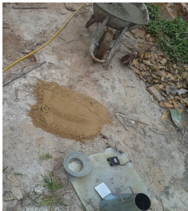
Figura 1. Girica com concreto, tronco de Abrams e materiais para obtenção do Slump Test.

Após o concreto pronto, retirava-se da betoneira uma quantidade equivalente de 40 a 60 litros de concreto com o auxílio de uma girica, para que os dados dessa pesquisa pudessem ser obtidos sem atrapalhar o andamento da obra.