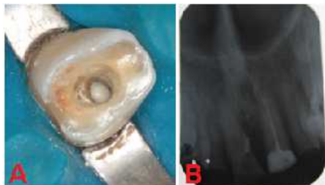
Figura 6. A: Perfuração selada com MTA (aspecto clínico); B: evidência do selamento com RX periapical.

Nesta etapa, o MTA foi depositado com aplicador próprio de MTA (Angelus, Paraná, Brasil) e uma bolinha de algodão úmida foi interposta entre o material restaurador provisório Coltosol (Coltene®) com o intuito de auxiliar na solidificação do cimento reparador. Decorridos 7 dias, o paciente foi novamente atendido sem sinais e sintomas. O material restaurador provisório e a bolinha de algodão foram removidos e a dureza do MTA foi cuidadosamente testado com uma sonda Rhein (S.S. White, Rio de Janeiro, Brasil). Nesse dia foi localizado e acessado a câmara pulpar corretamente com uma broca