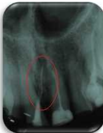
Figura 3. Radiografia inicial. No detalhe observa-se perfuração mesial a nível cervical e cones de guta percha inseridos no periodonto.

Para sua remoção, uma lima K File #15 (Dentsply Maillefer, Tulsa, EUA) foi torcida em forma de anzol na sua ponta com a intenção de “pescar” esse fragmento e após insistentes tentativas alcançou-se o sucesso, removendo agora todo o fator etiológico do abscesso (Figura