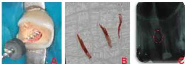
Figura 4. Remoção parcial da guta percha. A: mostrando remoção com uso de lima tipo Hedstroem; B: Fragmentos removidos; C: Radiografia evidenciando permanência de fragmento (detalhe).

5). A hemorragia foi controlada com irrigação meticulosa de hipoclorito de sódio 1%. Uma curetagem para remoção do tecido inflamatório foi realizada e em seguida uma porção de pó de hidróxido de cálcio P.A. (Biodinâmica®) foi inserido para promover a hemostasia e auxiliar na desinfecção local. A perfuração foi selada com MTA Angelus de cor branca (Angelus, Paraná, Brasil) na proporção de 3:1 pó/líquido (Figura 6).