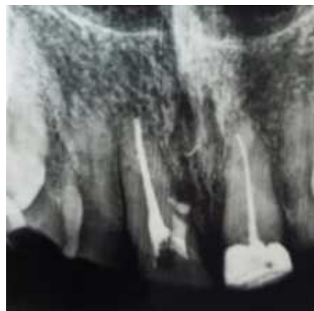
Figura 7. Radiografia digital final após 30 dias.

1011haste longa (KG Sorensen). O comprimento de trabalho foi determinado com Mini Root ZX (Morita, Kyoto, Japão) e o preparo biomecânico com limas Reciproc R25 (VDW, Munique, Alemanha) e hipoclorito de sódio 2,5%. O canal foi obturado com pontas de guta-percha e cimento AH Plus (Dentsply Maillefer, Tulsa, EUA). Após 30 dias não se observou nenhuma rejeição do selamento com cimento MTA e a bolsa periodontal regrediu para 5mm (Figura 7).