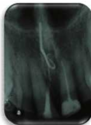
Figura 2. Rastreamento de fístula.

Foi proposto ao paciente uma intervenção não cirúrgica, com a remoção da guta-percha do periodonto via perfuração radicular e tratamento endodôntico do dente 11. Sendo assim, foi realizado a remoção do material restaurador à base de compósito fotopolimerizável com uma broca 1014 haste longa (KG Sorensen) em alta rotação. Após a localização da iatrogenia, o dente foi imediatamente isolado com lençol de borracha. O material obturador endodôntico foi inicialmente removido com uma lima Hedström #60 (Dentsply Maillefer, Tulsa, EUA). A tomada radiográfica para confirmar se todo material obturador havia sido removido, mostrou um fragmento de guta-percha que se despreendeu do restante e permaneceu isolado no periodonto do paciente (Figura 4).