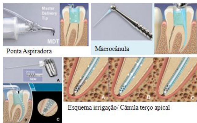
Figura 2. Imagens ilustrativas do sistema de irrigação por pressão apical negativa ENDOVAC ® .

damento, remoção de smear layer e biofilme. O fabricante recomenda a sua utilização na irrigação final, preenchendo o conduto com EDTA a 17% e ativando a solução por 60 segundos 57 . Na Figura 4, pode ser observado um exemplo de dispositivo ultrassônico utilizado para irrigação endodôntica.