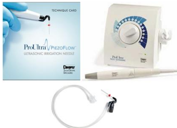
Inserto a ser acoplado ao aparelho de ultrassom Pro Ultra PiezoFlow Dentsply ®