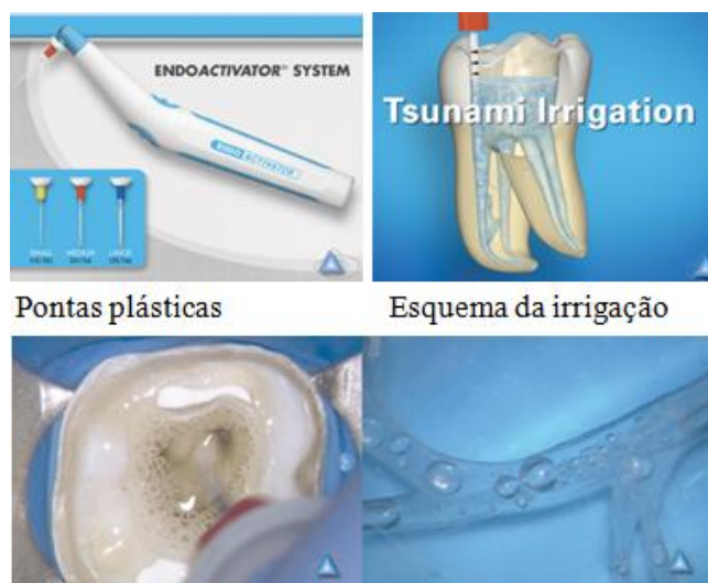
Figura 3. Componentes do sistema sônico ENDOACTIVATOR SYSTEM ® .