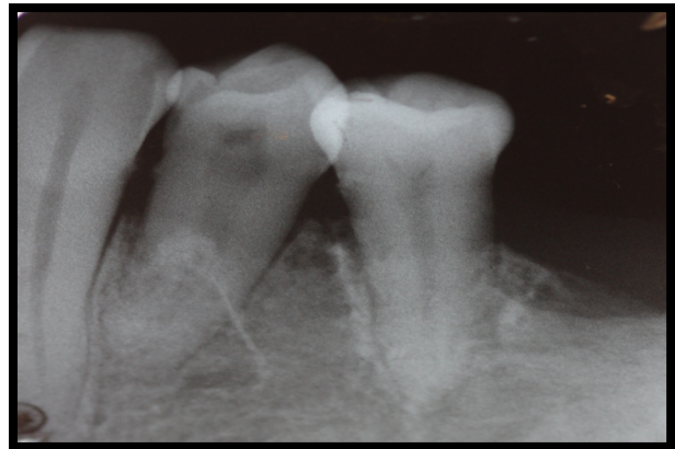
Figura 5. Rx periapical pós-cirúrgico