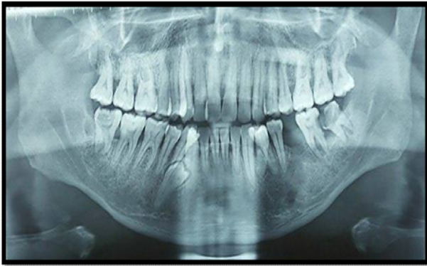
Figura 2. Radiografia panorâmica inicial dos supranumerários.

se encontrava por vestibular na região dos pré molares no hemiarco direito e por palatina no esquerdo.