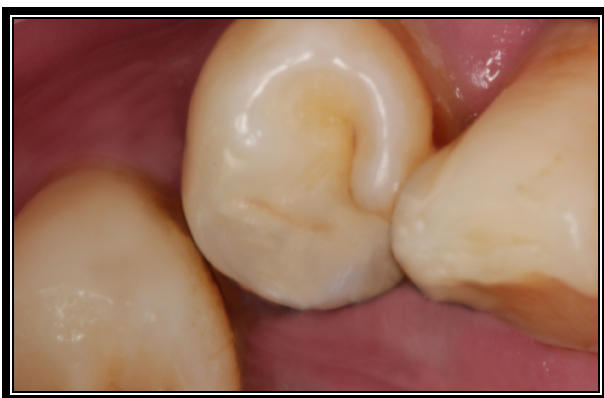
Figura 4. Após 60 dias da remoção do supranumerário

Durante o tratamento o paciente não autorizou a remoção do dente supranumerário que se encontrava intra ósseo, que se encontrava por vestibular na região dos pré molares no hemiarco direito observado na Figura 6.