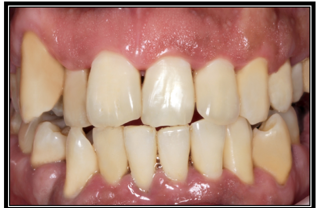
Figura 7. Foto final sorriso