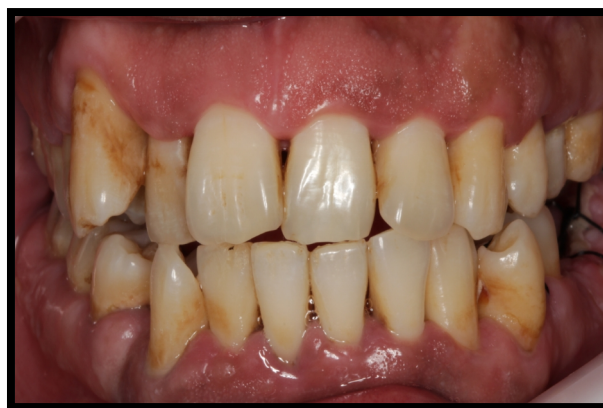
Figura 1. Foto frontal do Sorriso

Paciente do gênero masculino, com 31 anos de idade, leucoderma, procurou atendimento na clínica odontológica na Faculdade INGÁ, em julho de 2014, com queixa de possuir um dente de forma estranha atrapalhando o alinhamento dos dentes e a estética (Figura 1).